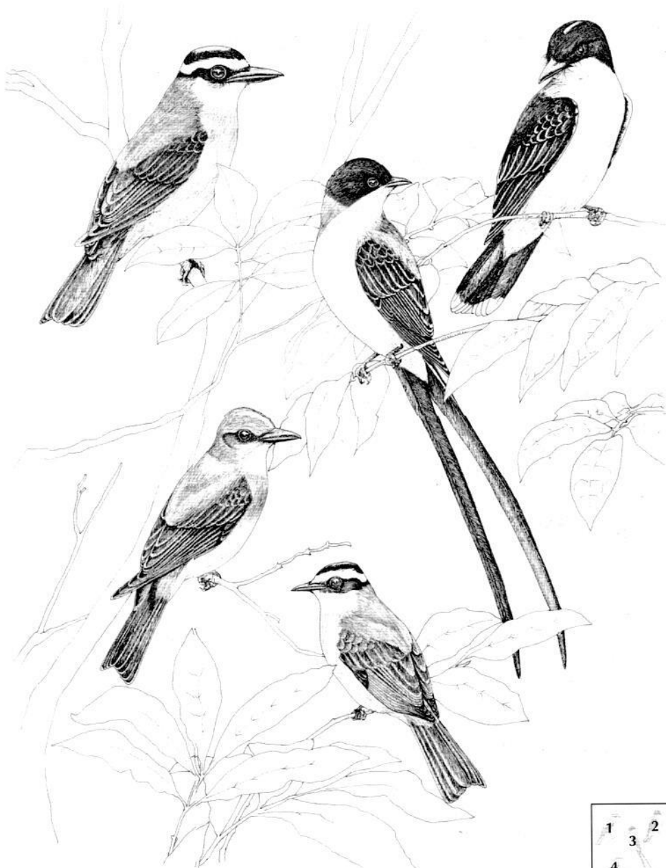
1. Bichofué Gritón, 2. Tirano Migratorio, 3. Tirano Tijereta, 4. Sirirí Común, 5. Suelda Crestinegra.